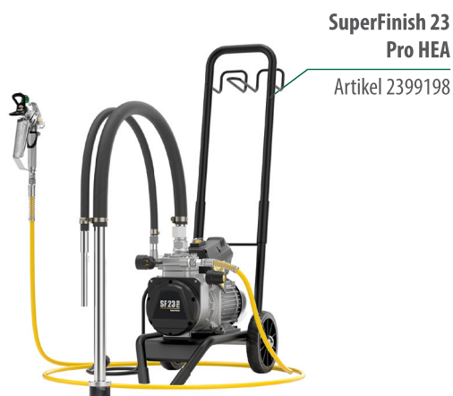
SuperFinish 23 Pro HEA Artikel 2399198